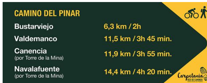
Bandera Red Básica.