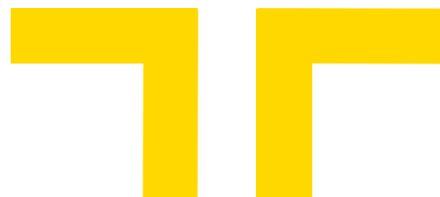
Giro a la izquierda o derecha.